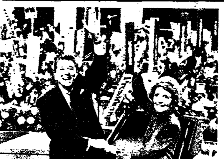
رونالد ريفان وزوجته بلوكان للجمهوريين المحتشد لتحتبه بعد ان اصبح مرشح الحزب الجمهوري الاميريكي لانتخابات الرئاسة الامريكية.

وكانت الجهة في بيان نشر في عدد من الصحف البيروتية انه رغم الممارسة التاريخية لسماحة السعودية فلنا تنفي هذا التبا من اساسه.